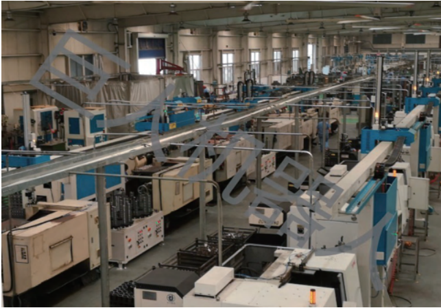
※ 車床取放 一對多桁架 (產線整合) 1 ROBOT - Multi CNC Tending