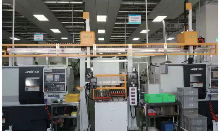
※ 車床取放 雙通道二對二桁架 (共用料盤軸) 2 Robot-Multi CNC Tending